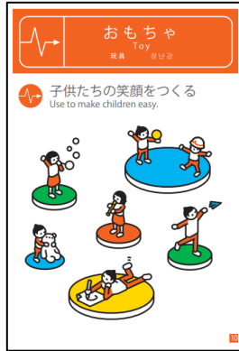
パンフレットの例

1. 先生は学生に地震に関する知るべきの 単語や漢字を記録するワークシートを配 って、そなエリア東京の72時間生き抜く ヒントというパンフレットが載せられて いるパワポを見せる。その後、皆でパン フレットにある言葉は学生が考えたのと 一緒かどうかを確認する。